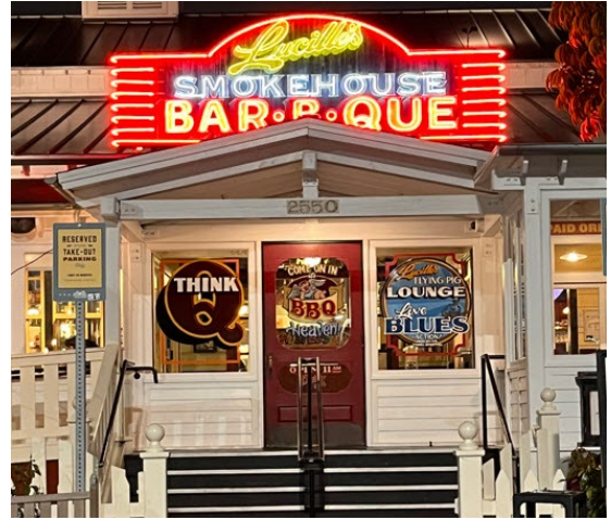
Lucille's Tustin, California