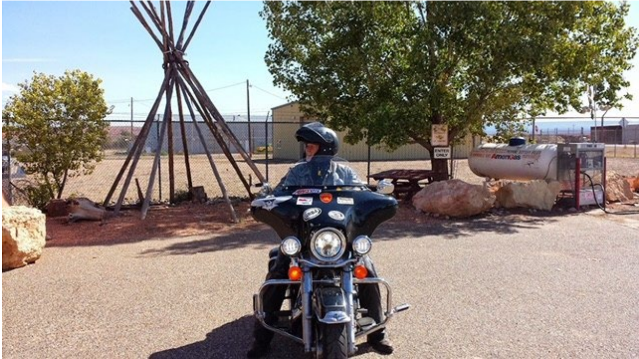
Gonzo en Kanab, Utah

se reportó a la Escuela de Aspirantes a Oficiales en Quantico, Virginia, y recibió una Comisión de Reserva como Teniente 2º.