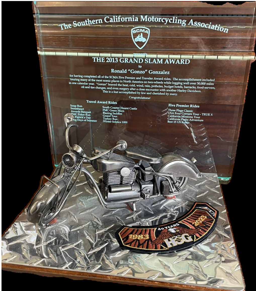
El primer premio SCMA Grand Slam de la historia

Para reconocer este logro, Gonzo se convirtió en el primer ganador del Premio SCMA Grand Slam. Gonzo también se convirtió en Director de Membresía ese año.