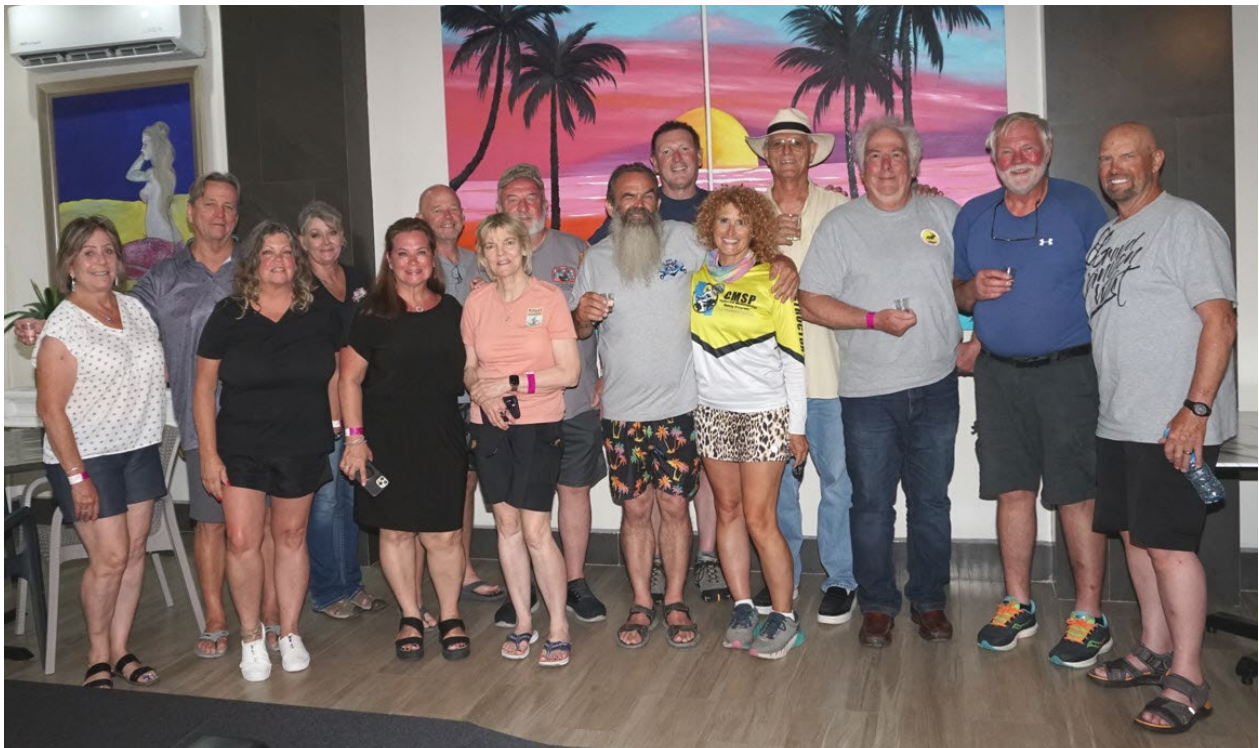
TFC23 Committee and Guests in Playa Bonita Resort - Puerto Peñasco