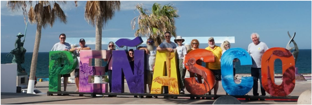
TFC23 Puerto Peñasco