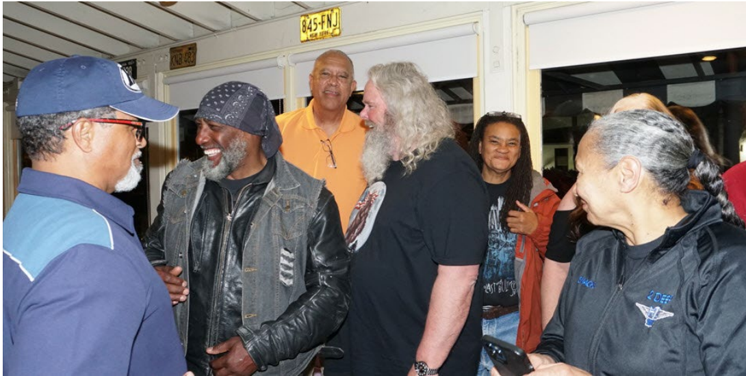
Uno divertido antes de una foto grupal.