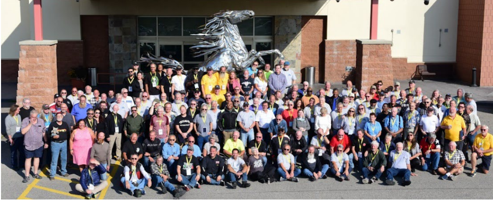
Finalistas de Clásico de las Tres Banderas 2023 en el Deerfoot Hotel,

Echa un vistazo a los enlaces a todas las fotos del Clásico de las Tres Banderas 2023. Pedimos fotos a los participantes e hicimos un concurso. Tenemos fotos del banquete de salida y de las preciadas fotos de llegada del motociclista. Hay muchos más de todo el evento, incluidos los de los motociclistas de Out on the Road. Los motociclistas han visto la mayoría de estos, aunque algunos se han agregado recientemente. Recogimos lo mejor en el Álbum del Concurso de Fotografía. Hubo tantas tomas geniales que representan la belleza, la aventura y la diversión de la carretera abierta y las celebraciones a lo largo del camino. Echa un vistazo.