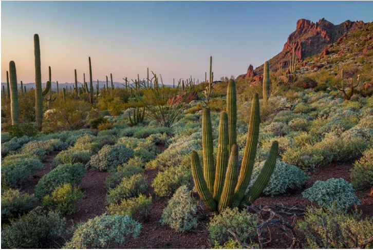
Organ Pipe Cactus National Monument

Ed. Nota - Pensamos que podría ser de interés para usted para compartir algunas investigaciones de lo que vamos a pasar a través de este año en el paseo del Clásico de las Tres Banderas. Usted puede ser un motociclista registrado o un motociclista potencial que aún no se ha comprometido. En estas páginas se indican las opciones de parada en esta ruta o en una futura ruta por esta zona. Obviamente, hacerlas todas alargaría demasiado los días. Puede que veas algo especial que te gustaría añadir a tu programa del día. Puede que sólo sea un lugar para hacer fotos. Uno de los que de otra manera podría perderse, esta vez.