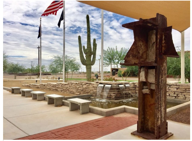
Gila Bend 9/11 Memorial

Gila Bend se encuentra a unas 45 millas al norte, un antiguo cruce de caminos cuya historia se remonta a los tiempos de las diligencias y los carromatos. Aunque la cercana carretera interestatal hace que Gila Bend siga teniendo su parte de tráfico, ya no es el centro neurálgico que fue. Gila Bend alberga el emblemático y peculiar Space Age Lodge y su colección de arte y objetos de colección de temática espacial; sin duda merece la pena hacer una parada. En la ciudad se ha erigido un pequeño pero elegante monumento conmemorativo del 9/11, y el aeropuerto municipal, en el extremo norte de la ciudad, cuenta con un par de jets F-101 que están lo suficientemente cerca de la carretera como para hacer una foto con la moto.