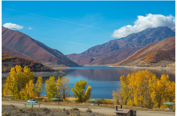
Deer Creek Reservoir

Nos dirigiremos hacia el norte y pasaremos por los embalses de Jordanelle y Echo Lake, ambos con un mirador para tomar fotos. También pasaremos por Park City, la meca del esquí y sede del Festival de Cine de Sundance. Park City fue originalmente una ciudad minera de oro, plata y delantera; cayó en recesión cuando los precios de los metales bajaron sustancialmente tras la Gran Depresión. No se convirtió en destino de esquí hasta una campaña de promoción de los deportes de invierno en la década de 1960. Una vez pasado Echo Lake, nos dirigiremos hacia la frontera estatal y cruzaremos a Evanston, WY.