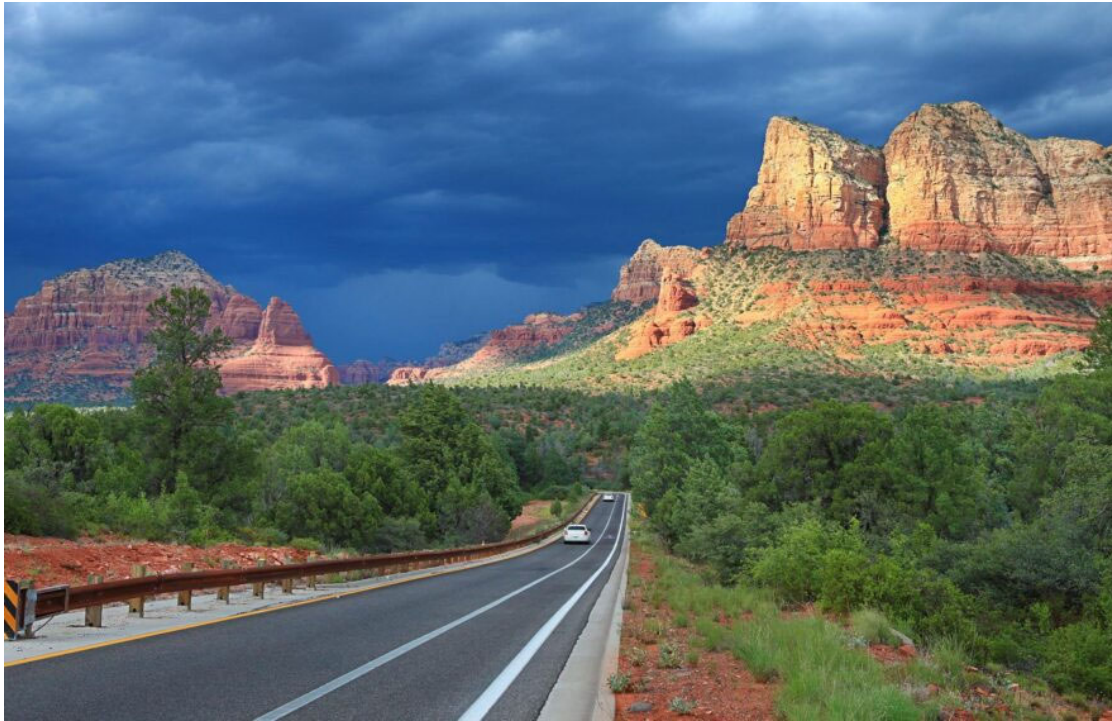
Red Rock Scenic Byway

Saliendo de Camp Verde, atravesaremos el Bosque Nacional de Coconino mientras ascendemos hacia Flagstaff, a 1.6900 pies. Esta parte de Arizona presenta una serie de accidentes geográficos como Bell Rock y Courthouse Vista en las zonas cercanas a los Parques Estatales de Red Rock y Slide Rock. Después de pasar por la zona de Flagstaff, continuaremos hacia el norte atravesando la cordillera de la Nación Navajo en dirección a Tuba City.