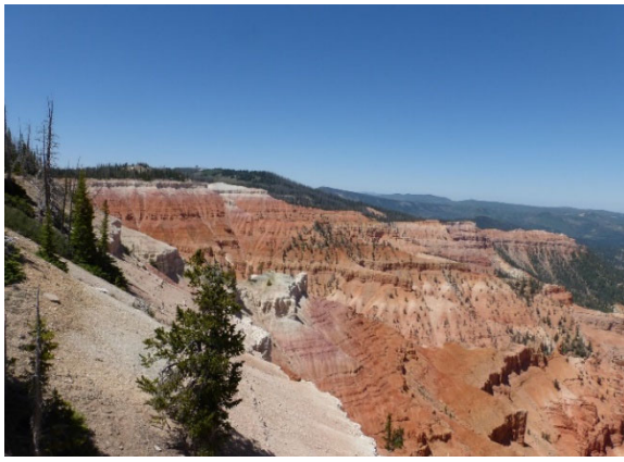
Cedar Breaks National Monument

Kanab se encuentra en el extremo sur de la zona de Long Valley y a lo largo de la bifurcación Este del río Virgin. Hay una serie de accidentes geográficos en los alrededores, y Kanab sirve como puerta de entrada sur a la zona Mighty 5 de Parques Nacionales de Utah. Hay un par de puntos interesantes justo al norte de Kanab que probablemente sea mejor visitar al final del primer día. Hay una zona de cuevas de arena en el terraplén a lo largo del antiguo cauce del río, a varias de las cuales se puede acceder mediante una caminata moderada desde la zona de estacionamiento. A menos de un kilómetro y medio al norte se encuentra la cueva de Moqui, que también funciona como museo histórico. El horario normal es de 9 de la mañana a 7 de la tarde.