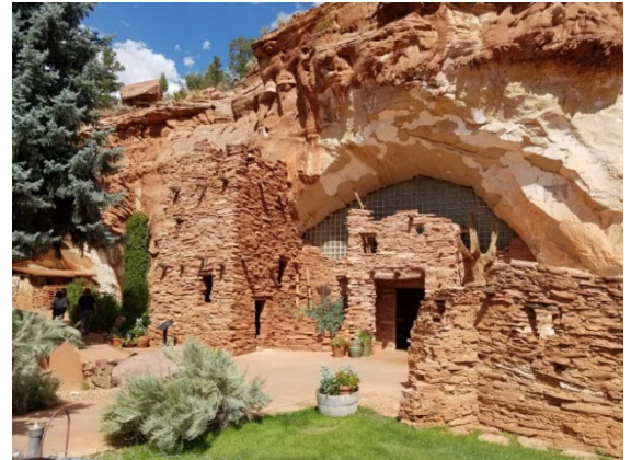
Moqui Cave Exterior

Ed. Nota - Pensamos que podría ser de interés para usted si compartimos algunas investigaciones de lo que vamos a pasar por el viaje de este año Clásico de las Tres Banderas. Puede que seas un motociclista registrado o un motociclista potencial que aún no se ha comprometido. En estas páginas se indican las opciones de parada en esta ruta o en una futura ruta por esta zona. Obviamente, hacerlas todas alargaría demasiado los días. Puede que veas algo especial que te gustaría añadir a tu programa del día. Puede que sólo sea un lugar para hacer fotos. Uno de los que, de otro modo, podría perderse esta vez.