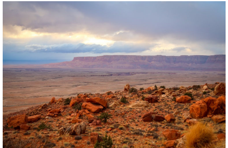
Antelope Pass Vista