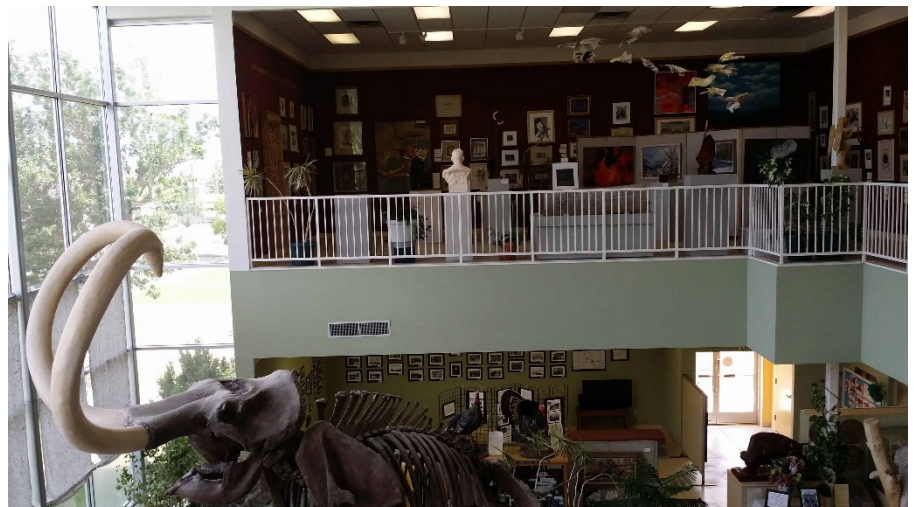
Fairview Museum Mammoth

Pasaremos por las ciudades de Ephraim, Mt. Pleasant y Fairview en nuestro camino hacia el norte. Ephraim cuenta con el Museo y las Cabañas del Campamento de Fort Ephraim, así como con una tienda de malta a la antigua usanza, por si le apetece tomar algo fresco. Seguro que le trae gratos recuerdos pasar por el Basin Drive-In Theatre de Mt. Pleasant, que aún sigue en funcionamiento. Continuando hacia el norte, pasaremos por Fairview, cuyo importante Museo de Historia y Arte incluye una réplica a tamaño real del esqueleto del mamut lanudo