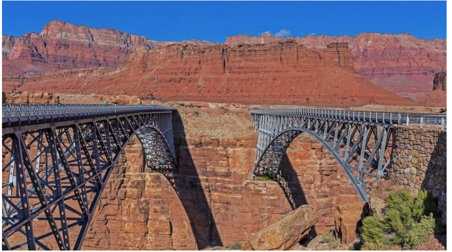
Marble Canyon Bridges

A medida que nos acercamos al límite de la Nación Navajo en el río Colorado, desde el mirador de Antelope Pass podrá disfrutar de una impresionante vista de Marble Canyon y la zona de Vermillion Cliffs. En el río, puede explorar un mercado navajo, conocer la historia de la zona en el centro de visitantes o pasear por el histórico Puente Navajo. En Lee's Ferry, donde el cañón se ensancha, podrá contemplar mejor las paredes de mármol del cañón. Lee's Ferry es un destino popular para pescadores con mosca y balseros. La carretera está totalmente asfaltada y hay un desvío en el embarcadero.