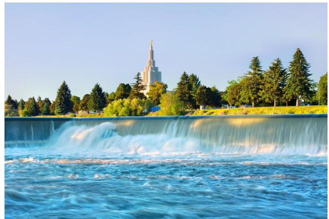
Idaho Falls and Temple

Continuando hacia el norte, entraremos en la ciudad de Alpine, en la confluencia de los ríos Greys, Salt y Snake, que desembocan en el embalse de Palisades. Viajaremos hacia el noroeste a lo largo del embalse a través de los bosques nacionales de Targhee y Caribou. El río Snake sale del embalse cerca de la ciudad de Palisades (vaya usted a saber); si le interesan las antigüedades o las curiosidades, quizá quiera echar un vistazo a la tienda de la presa. Justo al oeste de Swan Valley, hay unas bonitas cascadas en la orilla sur del río, donde Fall Creek se une al río Snake en Fall Creek Falls. Después de las cataratas, la carretera se aleja del río, pero sigue ofreciendo magníficas vistas de las montañas Big Hole mientras atravesamos tierras de labranza de camino al punto de control del segundo día en Idaho Falls. Si le apetece algo diferente, puede probar una excursión a un rancho (¡o una caminata!) en Wilderness Ridge Trail Llamas; pasaremos por sus establos unas 15 millas antes de entrar en Idaho Falls. Si le apetece explorar un poco más el río, el punto de control está muy cerca de la vía fluvial que bordea el río Snake en el centro de Idaho Falls.