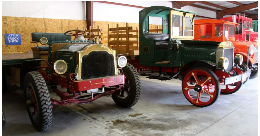
Robinson Truck Museum

Salina es una ciudad de 2500 habitantes que sirve de centro regional y soporta los viajes por la I-70, así como el tráfico comercial de las minas de sal de la cercana Redmond. Los aficionados a las motos pueden visitar el Museo del Camión Robinson, mientras que los aficionados a la historia pueden disfrutar del campamento restaurado Camp Salina CCC/POW y su legado bastante infame.