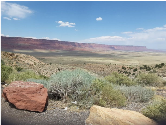
House Rock Valley Overlook

Continuando desde Marble Canyon, recorra la base de los acantilados Vermillion antes de ascender a la meseta Kaibab, a 8000 pies de altitud. Desde el mirador House Rock Valley podrá disfrutar de unas magnificas vistas de los acantilados y el valle, mientras asciende hasta la ciudad de Jacob Lake. Jacob Lake es una de las pocas fuentes de agua permanentes de la meseta Kaibab. La cercana posada Jacob Lake Inn data de 1923 y ofrece una gran variedad de productos recién horneados si desea refrescarse entre los pinos.