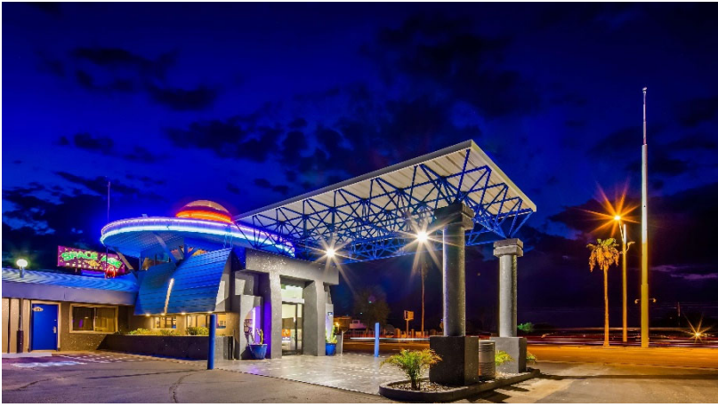
Gila Bend Space Age Lodge