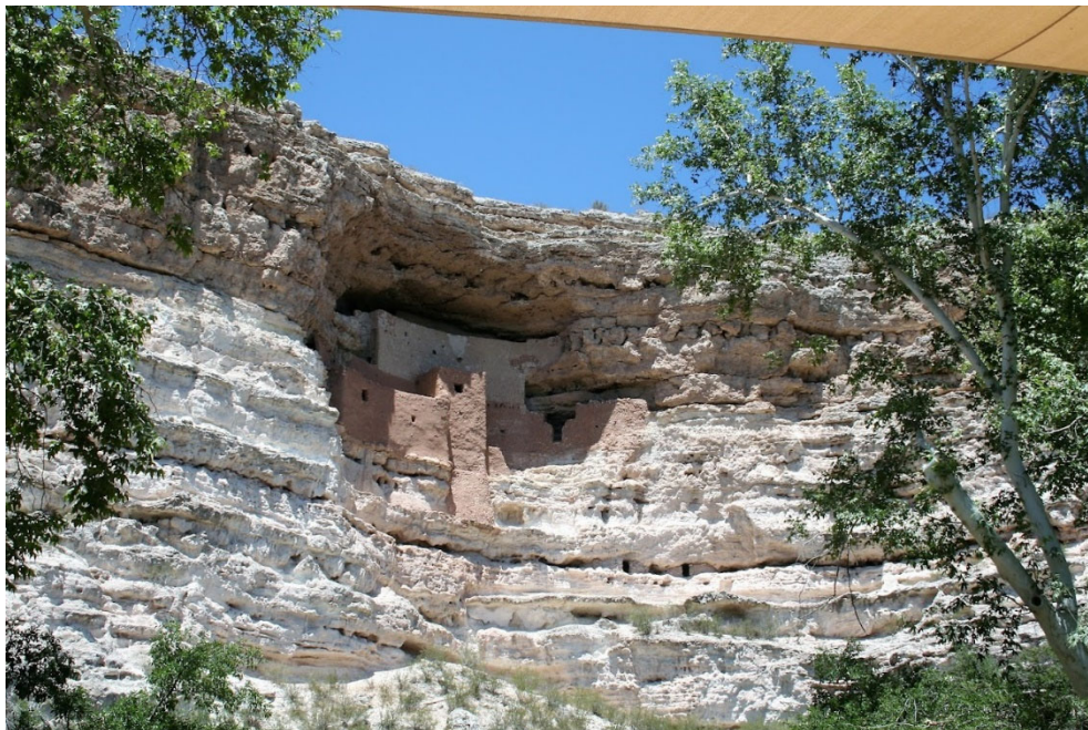
Montezuma Castle National Monument

Reanudando nuestro viaje hacia el norte, pasaremos por algunas de las zonas agrícolas de camiones a lo largo del río Gila antes de acercarnos al área metropolitana de Phoenix. Una vez en la zona metropolitana, reanudaremos nuestro viaje hacia el norte. El terreno se vuelve más accidentado y sinuoso a medida que ascendemos hasta los 2.000 pies. Hay una serie de paradas panorámicas para tomar fotos a medida que ascendemos hasta los 3.200 pies y nos acercamos a Camp Verde. Los alrededores de Camp Verde se han convertido en una notable región vinícola. También alberga el Monumento Nacional del Castillo de Moctezuma, una vivienda multifamiliar de gran altura excavada en un acantilado de arenisca. El monumento se encuentra a unos 2.5 millas de nuestra ruta.