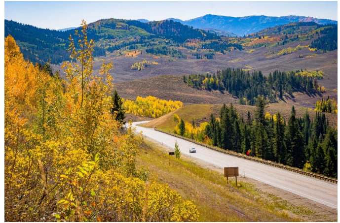
Salt River Pass

Continuaremos hacia el norte por la frontera entre Idaho y Wyoming antes de entrar en el Bosque Nacional de Bridger y el Valle de las Estrellas. En la cresta del paso de Salt River, a unos 7600 pies de altitud, hay un mirador panorámico en el que tal vez quiera hacer una foto. Es posible que también quiera hacerse una con el famoso Arco de Elkhorn, el más grande del mundo, a nuestro paso por Afton, WY. Afton también alberga el Call Air Museum, una historia muy concreta de la evolución de un popular avión fumigador, fabricado en Afton entre 1940 y 1970.