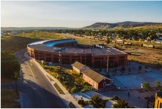
Evanston Locomotive Roundhouse Complex