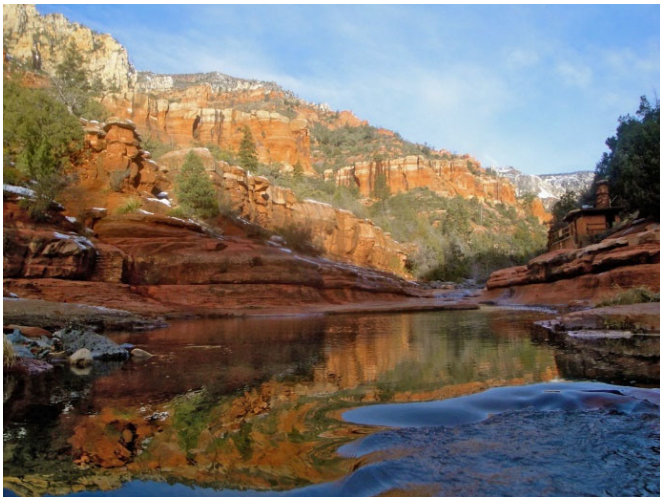
Oak Creek Slide Rock

Saliendo de Camp Verde, atravesaremos el Bosque Nacional de Coconino mientras ascendemos hacia Flagstaff, a 1.6900 pies. Esta parte de Arizona presenta una serie de accidentes geográficos como Bell Rock y Courthouse Vista en las zonas cercanas a los Parques Estatales de Red Rock y Slide Rock. Después de pasar por la zona de Flagstaff, continuaremos hacia el norte atravesando la cordillera de la Nación Navajo en dirección a Tuba City.